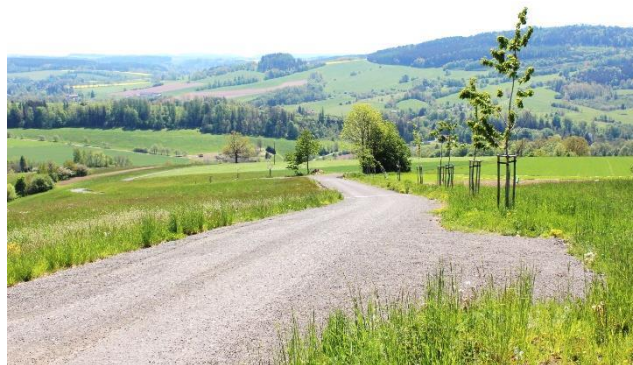
Vybudovaná cesta (HPC6) v rámci pozemkových úprav v katastrálním území Dolní Sytová