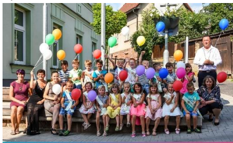
MŠ LIBŠTÁT – PŘEDŠKOLÁČCI 2019

Letošní slavnostní akt proběhl ve středu 26. června 2019 v 16 hodin v obřadní místnosti naší radnice. Akce se dle mého zdařila a věřím, že se líbila i rodičům a příbuzným, a těším se opět za rok.